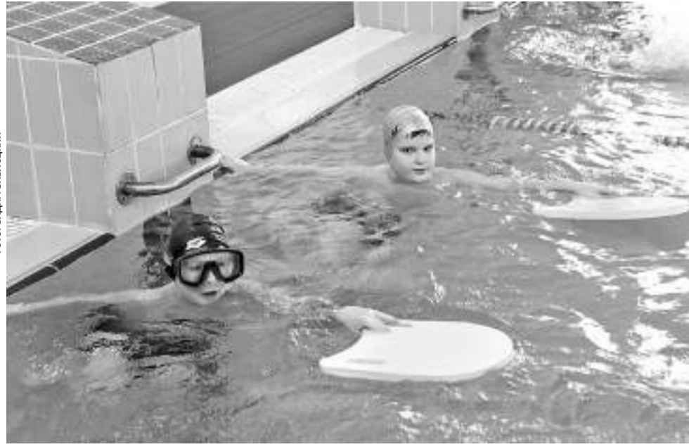
Внеурочка в Краснояружской школе № 2

Широко развитие в ШПД получили площадки для консультирования прежде всего по предметам, по которым есть письменные домашние задания, а также по наиболее трудным темам по любому предмету.