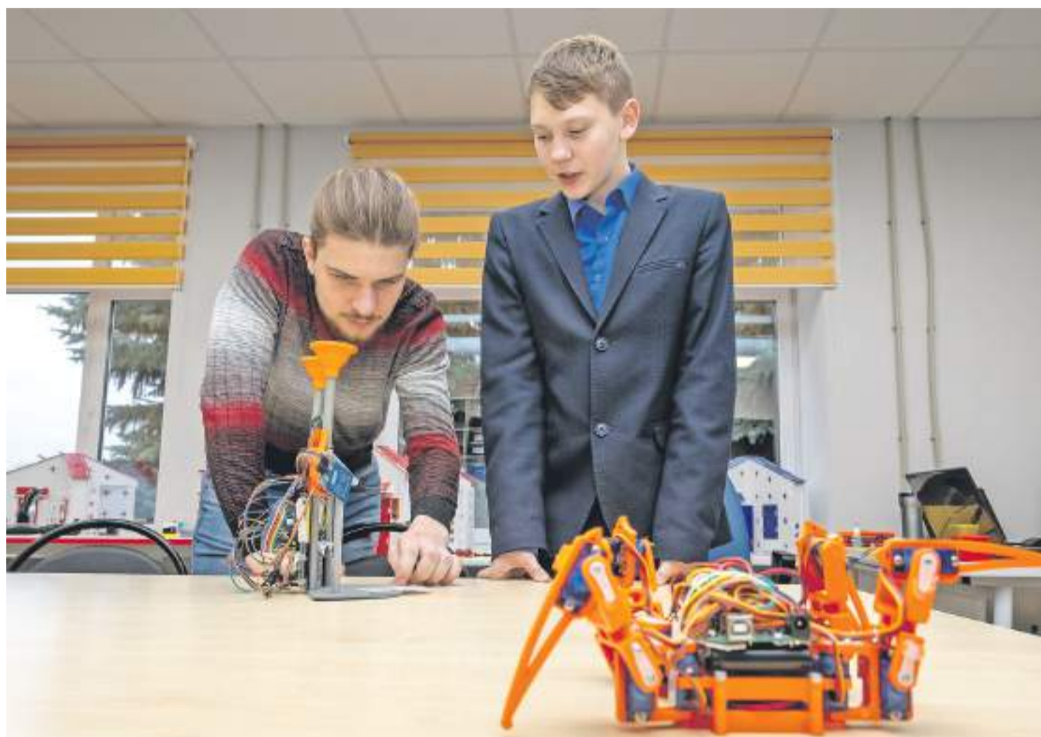
На занятии в детском технопарке, что разместился в Погореловской школе Корочанского района

Нацпроект «Образование» вызвал к жизни поиск наиболее интересных региональных практик, к которым с полным правом может быть причислена белгородская школа полного дня. Теоретические основы этого социально-педагогического явления были проработаны на проектных стратегических сессиях и концептуально представлены белгородскому сообществу в июле 2019 года, а уже с сентября 48 школ из 550 стали работать в таком режиме. В текущем учебном году таких школ 397, что свидетельствует об их востребованности.