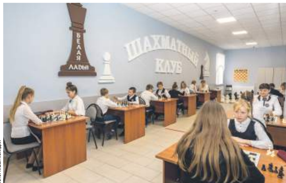
Шахматный клуб в Новооскольской школе с УИОП