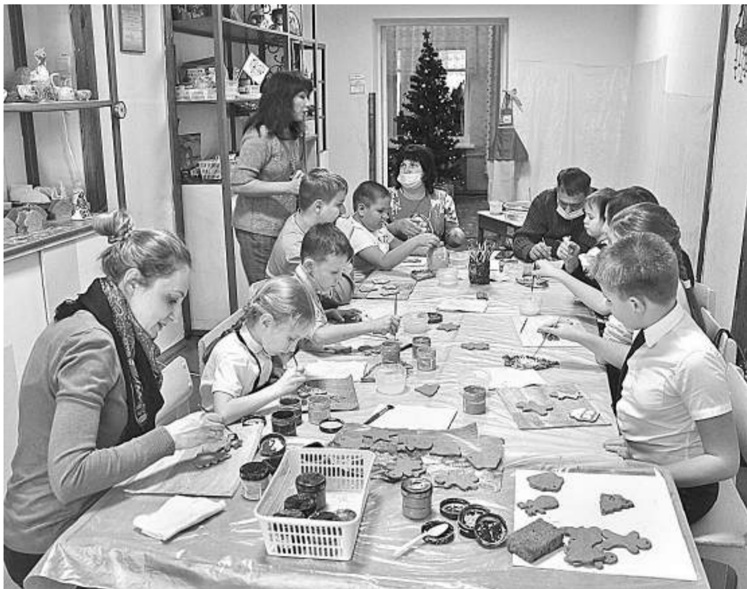
Занятие в гончарной мастерской «РАСпрекрасная керамика» в Губкинском центре внешкольной работы

На заключительный этап фестиваля было представлено 103 конкурсных видеоматериала по декоративно-прикладному, художественному и театральному творчеству, хореографии, вокалу, свободному творчеству. Члены жюри отметили высокий уровень исполнительского мастерства, творческий подход, разноплановый репертуар участников. Всех детей наградили дипломами, медалями, книгами.