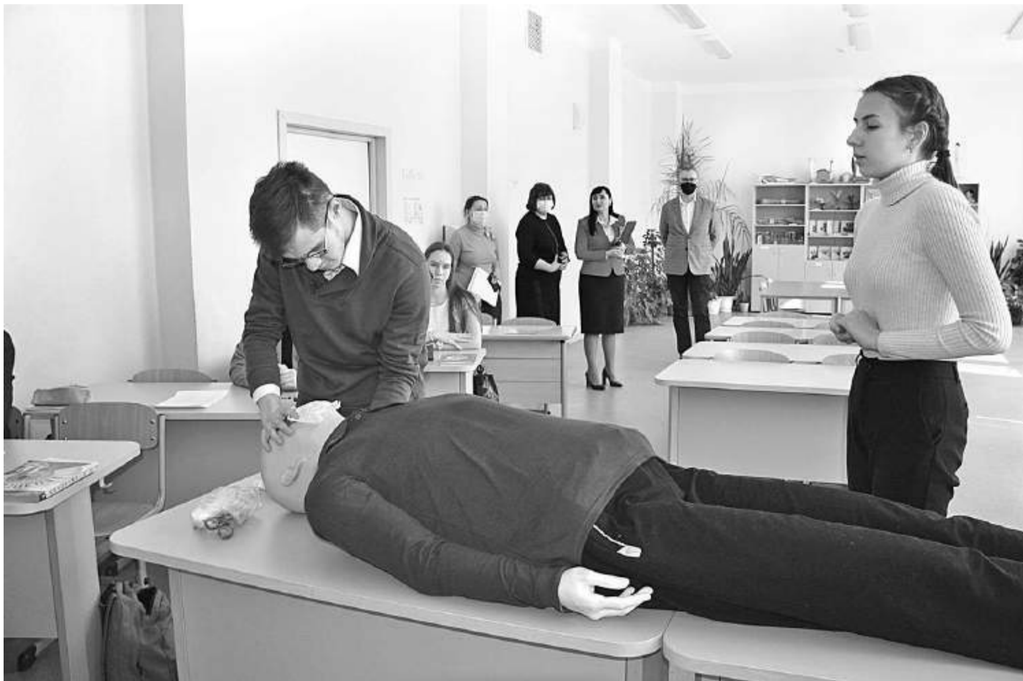
Урок биологии в медицинском классе Центра образования № 15 «Луч»

ПОЧЕМУ СЕЙЧАС В ШКОЛАХ НЕДОСТАТОЧНО ПРОСТО ПРОФИЛЬНОГО ОБУЧЕНИЯ