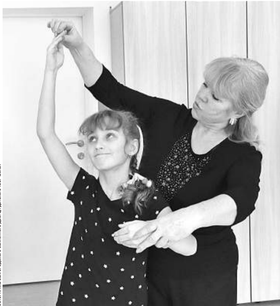
Занятия в хореографической студии для детей с РАС Белгородского областного дворца детского творчества

— Конечно. Мы провели мониторинг кадрового потенциала, педагогические работники проходят курсы и обучающие семинары на базе федеральных и региональных организаций высшего образования. В 2020 году обучили 91 педагога, 21 из них прошёл дистанционное обучение в Московском государственном психолого-педагогическом университете. Четыре педагога прошли дистанционные курсы повышения квалификации в институте коррекционной педагогики Российской академии образования по теме