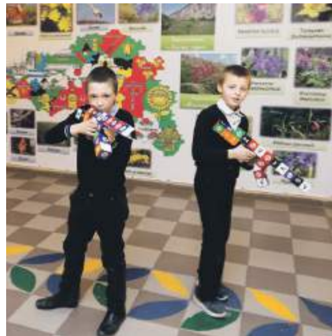
Игровая подвижная зона — любимое место учеников начальных классов Хотмыжской школы