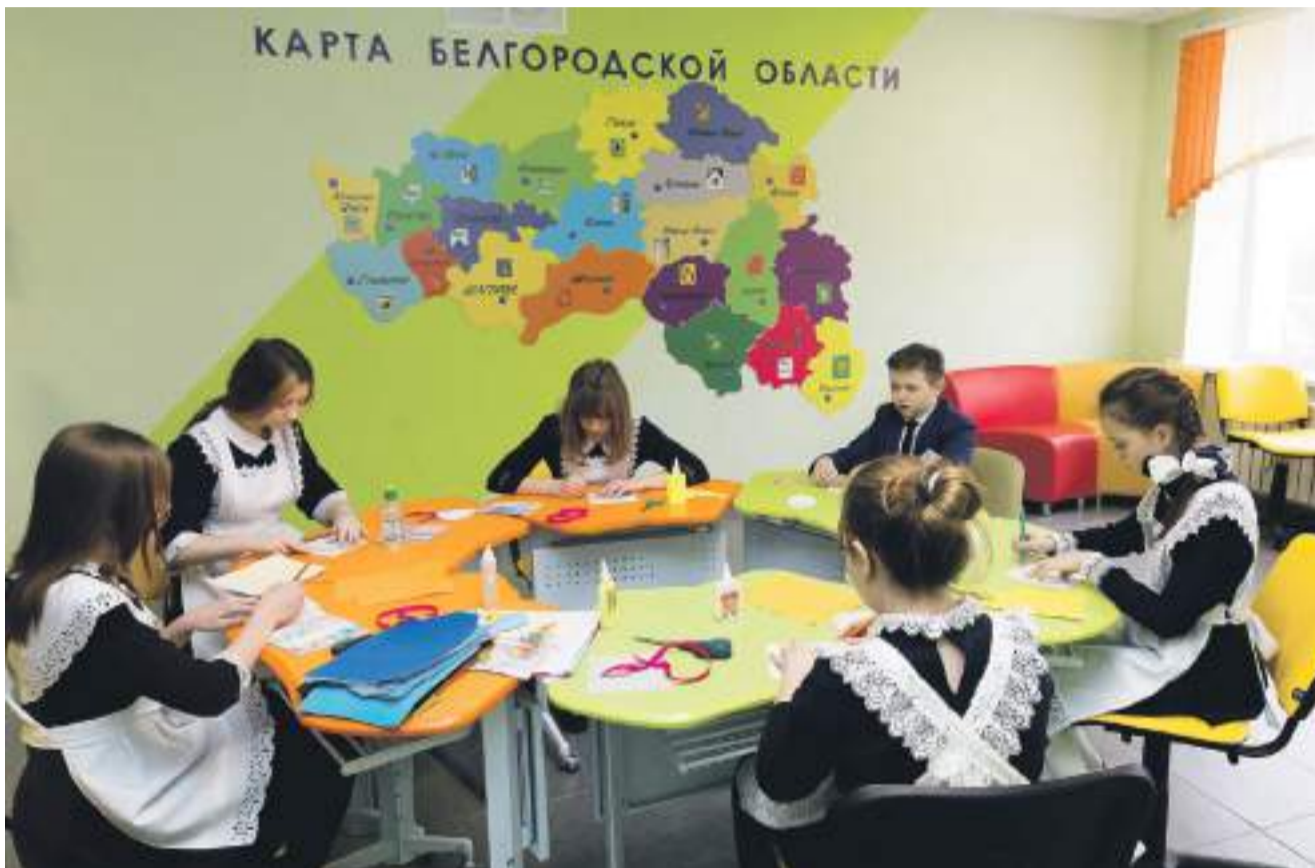
В коворкинг-зоне Крюковской школы ребята из изостудии делают пасхальную открытку