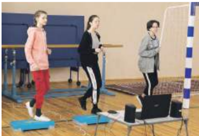
Для старшеклассников Хотмыжской школы на физкультуре и внеурочке проводят занятия по степ-аэробике