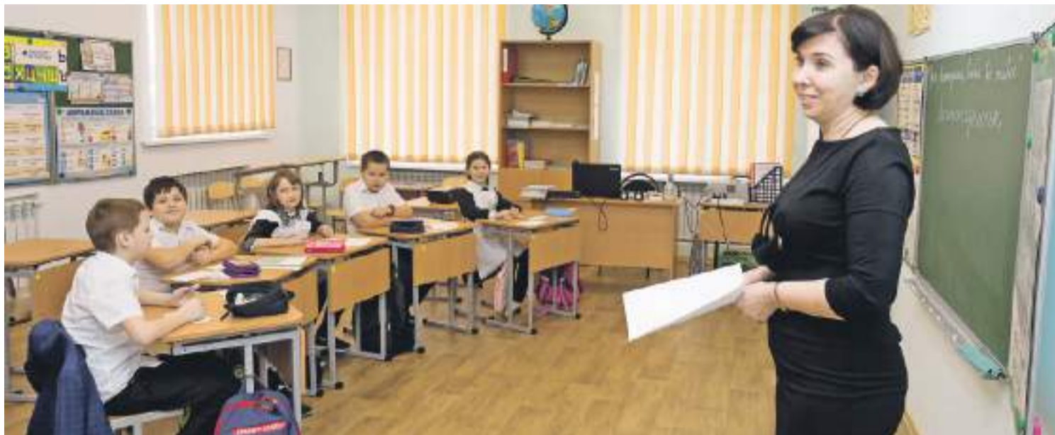
Классы Борисовской начальной школы им. Кирова маленькие — по 5–6 человек, так что можно поэкспериментировать с расстановкой парт, к примеру, поставить их полукругом

В школе есть телестудия «Репортёр» и уже 21-й год подряд неизменно раз в месяц выпускается газета «Мир детства». Кстати, в ближайшее время планируют выкладывать в открытый доступ электронную версию. С оперативностью ребята на «ты». Не успели мы посмотреть хореографический класс, мини-актовый зал, литературную гостиную, как на школьной страничке в соцсети «ВКонтакте» уже красовалось: «Сегодня в стенах нашей школы мы встречаем корреспондентов газеты «Доброжелательная школа Бе-