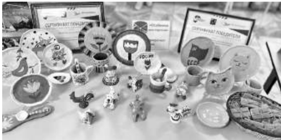
Работы учащихся гончарной мастерской «РАС Прекрасная керамика» Центра внешкольной работы г. Губкина

Первая ресурсная группа открылась в 2017–2018 учебном году в детском саду № 29 «Золушка». В текущем году ресурсные группы функционируют уже в трёх детских садах. Образование получают 15 детей.