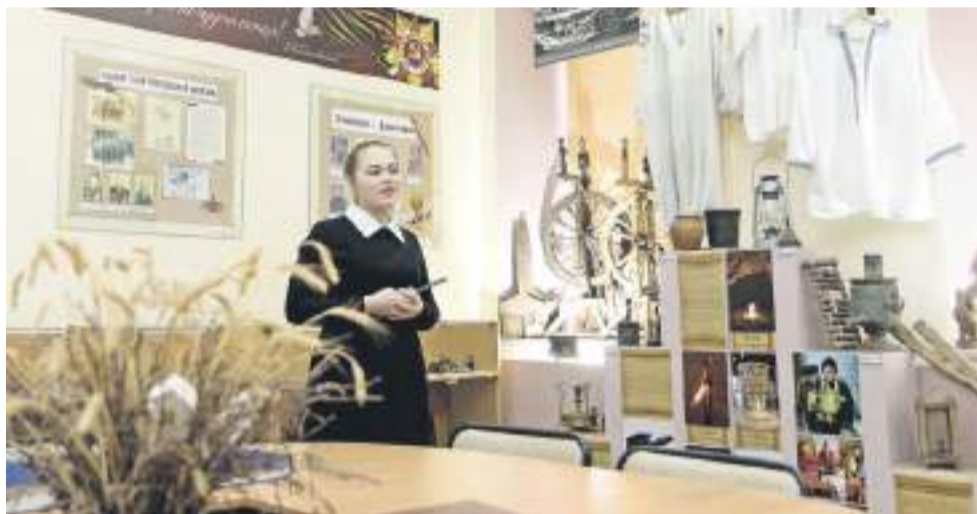
Историко-краеведческий музей Борисовской школы № 1 имени А.М. Рудого насчитывает 685 единиц хранения

логорья». Как и полагается, юные корреспонденты «приправили» запись хештегами: #БорисовскаяСОШ #газета_доброжелательная_школа #ДШ. Ведут также «Инстаграм» и совсем недавно создали Ютуб-канал. С контентом проблем нет. Школьники то и дело отличаются на районных, областных и всероссийских конкурсах и соревнованиях. Взять хотя бы школьную