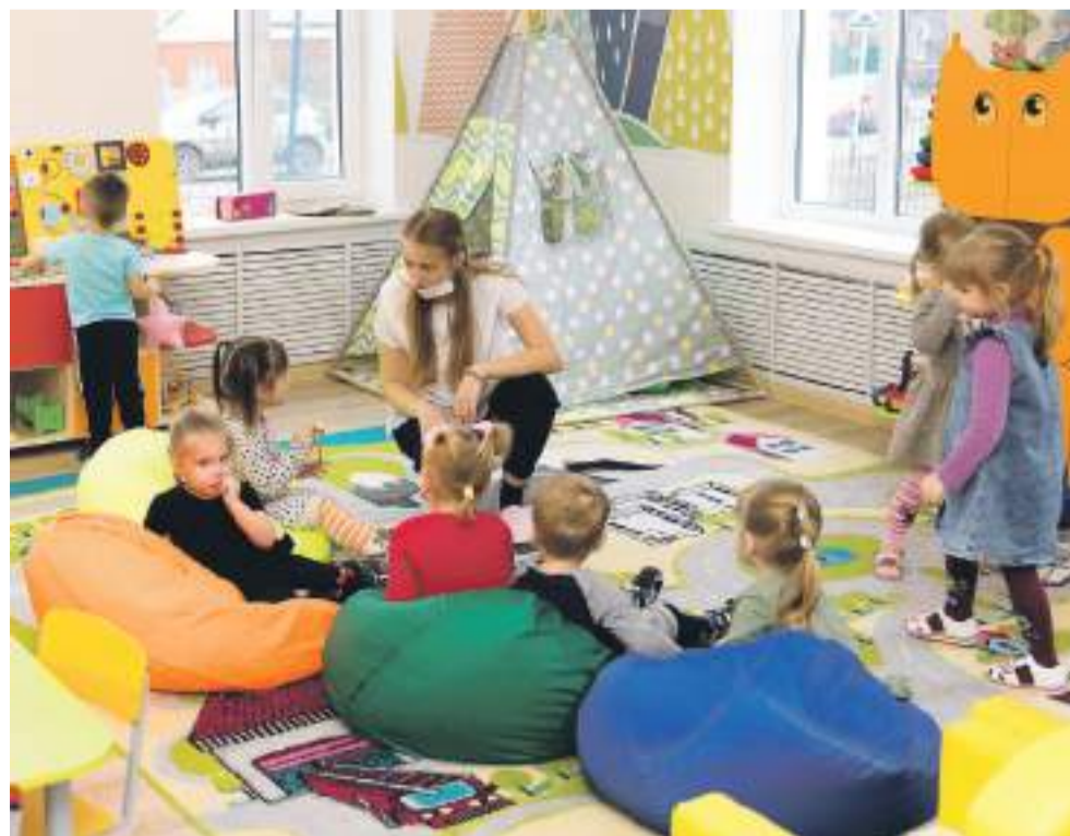
Игровая комната детсадовцев ясельной группы при Борисовской начальной школе им. Кирова