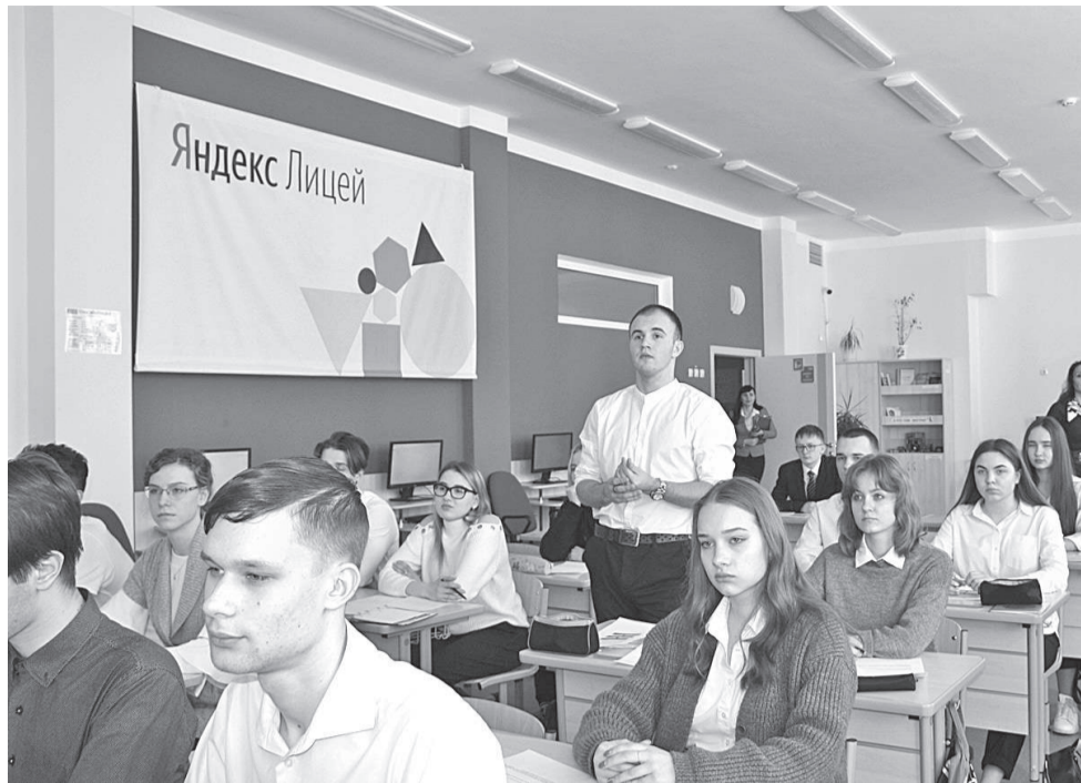
Урок информатики в IT-классе Центра образования № 15 «Луч»