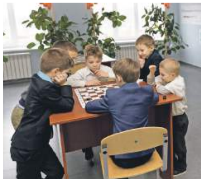
Шашечно-шахматная зона в Крюковской школе