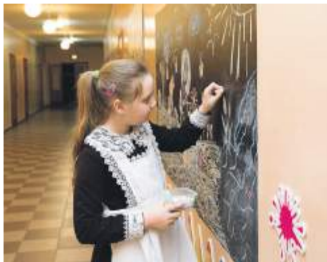
Ученики начальных классов Хотмыжской школы обожают рисовать мелками на досках в рекреации

КАК В БОРИСОВСКИХ СЕЛЬСКИХ ШКОЛАХ ИДУТ В НОГУ СО ВРЕМЕНЕМ